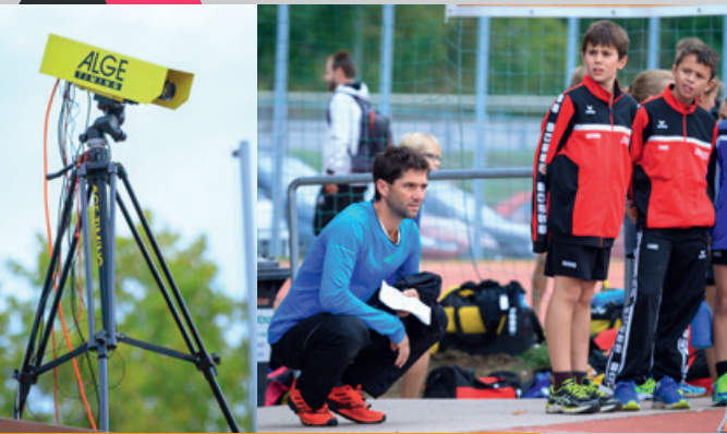
Alles im Blick