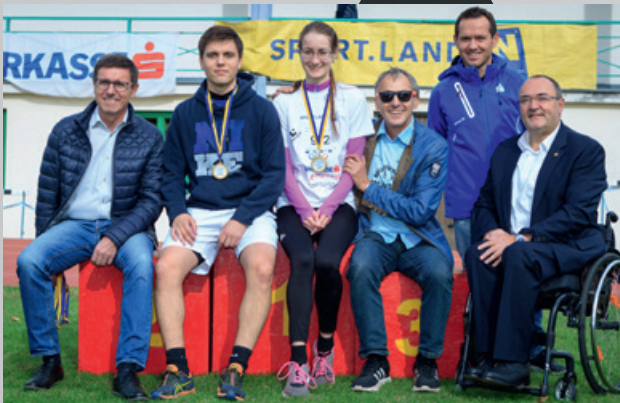
Gold fühlt sich gut an