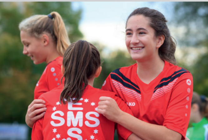
Laufen macht Spaß