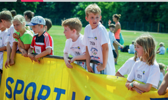
Alles im Blick