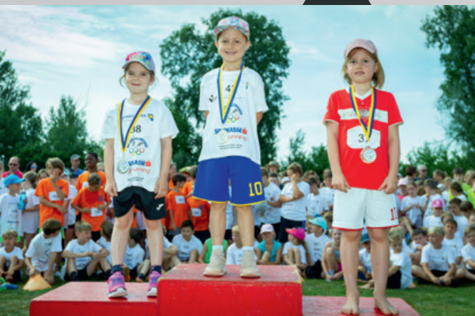
Gold fühlt sich gut an