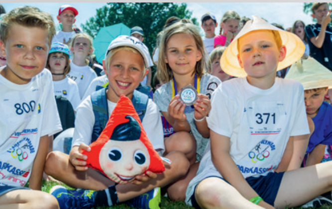
Laufen macht Spaß